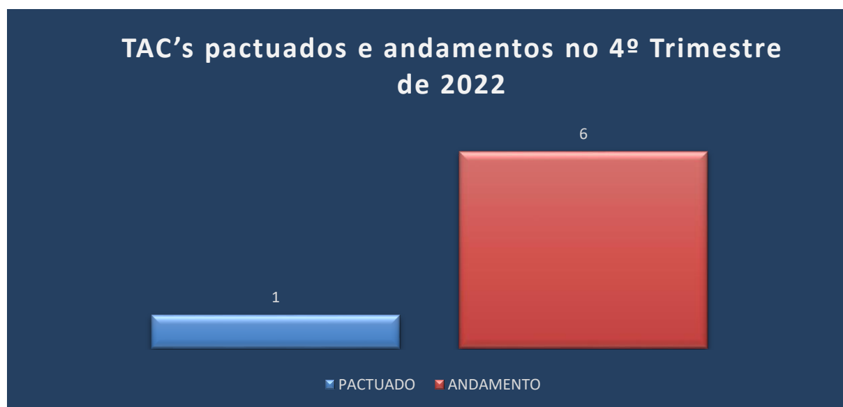
Figura 01 – Relação de TAC's pactuados e andamentos no 4º Trimestre de 2022

Durante o período 4º trimestre de 2022 - (01/10/2022 a 31/12/2022), a Corregedoria do SGB/CPRM, pactuou um TAC- Termo de Ajustamento de Conduta.